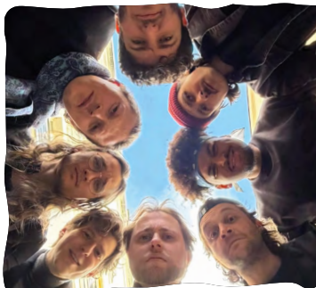
DR : KRMS

Le Bestiaire présente la fanfare KRMS, un rassemblement festif de six instrumentistes à vents et deux percussionnistes. Musiciens de divers horizons, leurs influences musicales sont multiples et leurs propositions éclectiques... avec toujours de quoi danser !