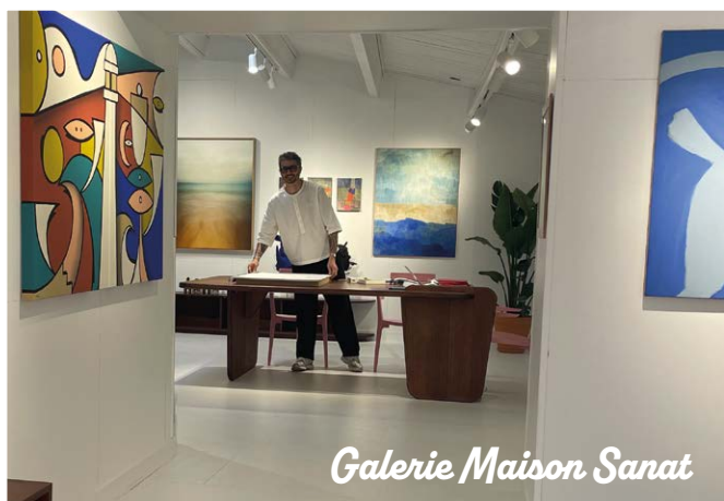
Galerie Maison Sanat