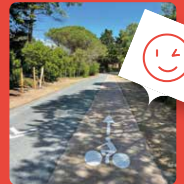
Route des Morines