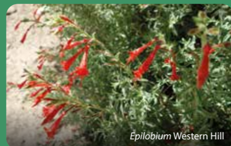
Epilobium Western Hill