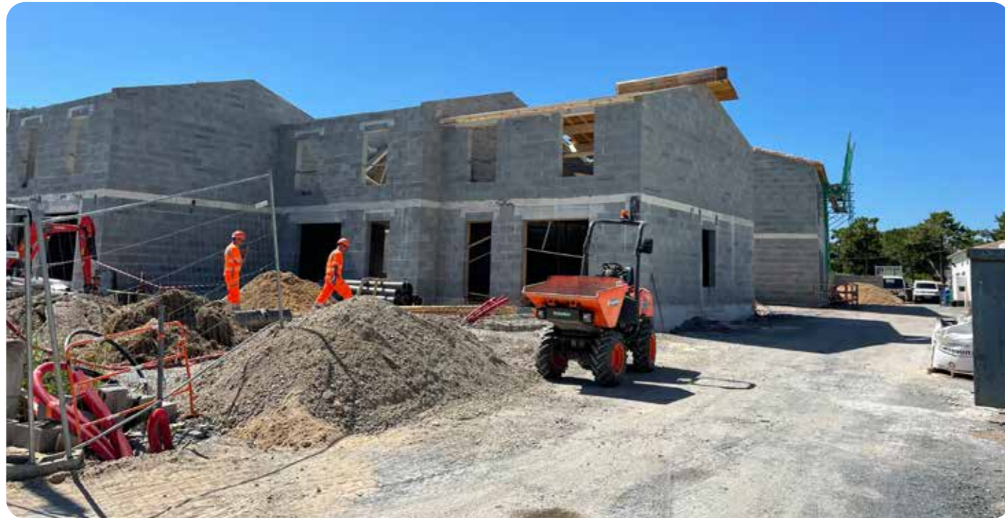
Travaux des logements sociaux

C' est un sujet qui occupe bien la municipalité. Tandis que la construction des logements de l'Allée des Peupliers avance à grands pas, voici que se profile déjà le chantier du Haut des Treilles 2, juste à l'entrée du village, au carrefour avec la route de la Filatte.