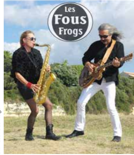
Les Fous Frogs

Le groupe de rock par excellence qui va ambiancer la Place en revisitant les standards de Police, Chuck Berry, les Rolling Stones mais aussi Alanis Morissette ou encore Sheryl Crow.