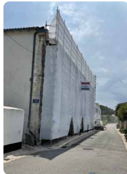
Travaux de la mairie