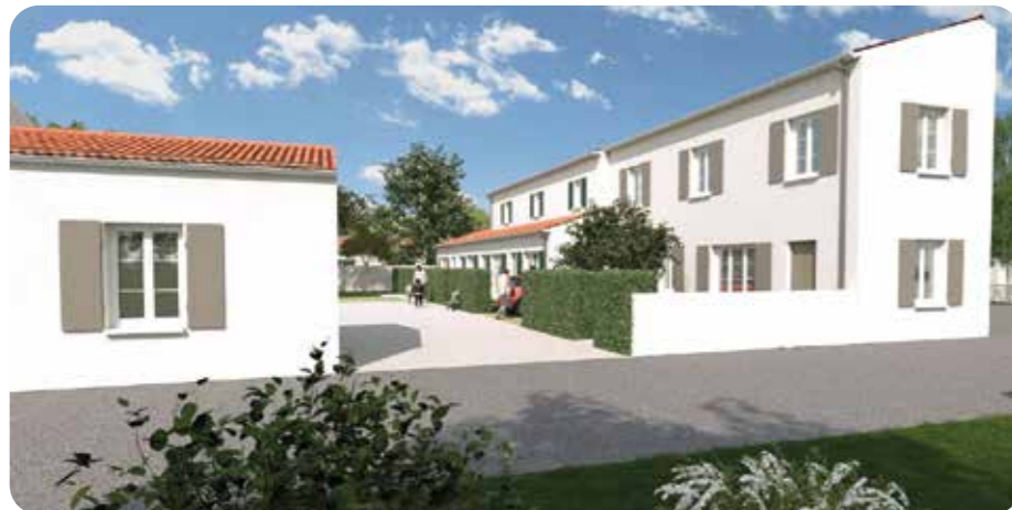
Haut des Treilles

a permis de structurer le dossier et de travailler sur des plans. Pour lancer le programme, dans l'idéal en début d'année 2025, le conseil municipal doit entériner le choix du bailleur social.