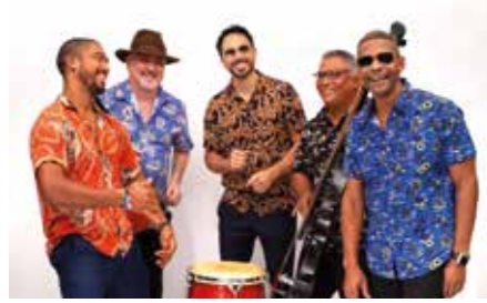
DR - Cuarteto Cubano