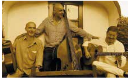
DR - Verdine Trio

Une soirée qui s'annonce dansante et « caliente » avec ces quatre musiciens d'origine cubaine qui nous proposent une musique, mélange de traditions cubaines et françaises.