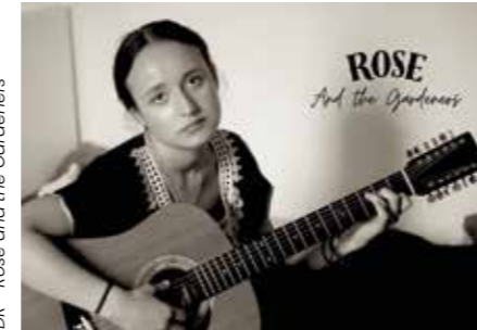
DR - Rose and the Gardeners

Pépite est un groupe de reprises funk et de soul originaire de La Rochelle, où l'amitié et la passion se mêlent pour créer une expérience musicale envoûtante avec leurs rythmes entraînants et leurs mélodies captivantes.