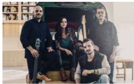
DR - SJ Cover

Un trio atypique avec contrebasse, violon et guitare qui perpétue et renouvelle le Jazz Manouche.