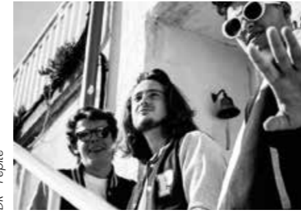
DR - Pépite

Prenez du pop-rock contemporain, ajoutez une cuillère de blues-ska-jazz-funk, un grand bol d'amour et une poignée généreuse d'humour. Servi avec du style et de l'énergie !